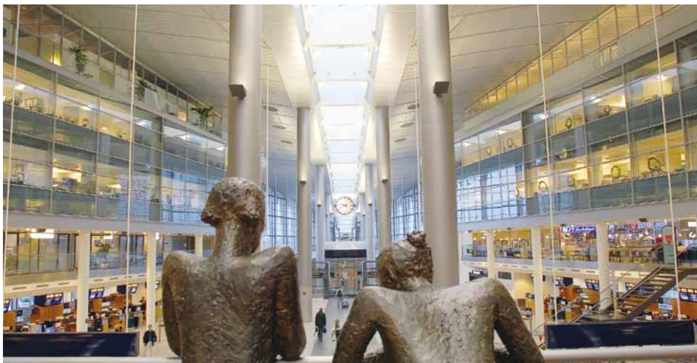
Das 230-Volt-Notstromversorgungssystem eignet sich auch für Flughäfen, Industriegebäude und Mehrzweckhallen

notwendig war, reduziert sich erheblich. Mit dem Einsatz der 230-Volt-Notstromzentrale reduzieren Sie im Vergleich zur herkömmlichen 24-Volt-Notstromtechnik den erforderlichen Kabelquerschnitt nahezu um den Faktor 10. Dementsprechend geringer fallen die Verkabelungskosten aus.